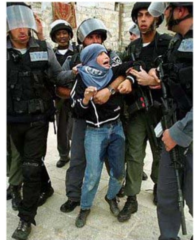
Mangsa 'Teori Penipuan'

Setelah melihat sorotan 2006 yang begitu menyedihkan buat umat Islam, timbul satu persoalan penting - adakah umat Islam masih mahu menari rentak yang sama pada tahun 2007 ini (mengikut acuan dan telunjuk Barat) atau kembali kepada Islam yang Syumul?