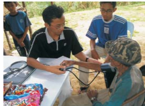
Sesi pemeriksaan kesihatan

Sagil, Tangkak – Misi Kembara Dakwah 1 yang dianjurkan oleh Ikatan Muslimin Malaysia (ISMA) dengan kerjasama World Assembly of Muslim Youth (WAMY) pada 2 & 3 Disember lalu telah mencerikan sejumlah penduduk orang asli yang telah sekian lama dipinggirkan. Perkampungan orang asli Air Tawas, Gunung Ledang yang terdiri daripada 20 keluarga orang asli ini telah menyambut kehadiran kira-kira 40 orang peserta dengan persiapan yang sederhana.