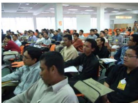
Tekun mendengar pembentangan kertas kerja