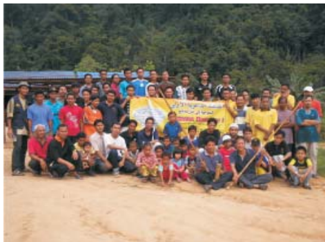
Peserta bergambar sebelum pulang