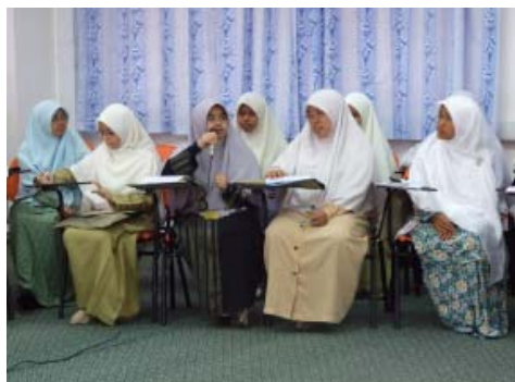
Sesi dialog bersama Presiden

Selangor – Satu seminar Belia Nasional 2006 telah berlangsung di Sekolah Menengah Teknik Sepang, Selangor anjuran Biro Pembangunan Belia (BPB) Ikatan Muslimin Malaysia (ISMA). Seminar selama empat hari ini bermula pada 22 hingga 25 Disember 2006 telah mengumpulkan seramai 110 peserta dari seluruh semenanjung Malaysia.